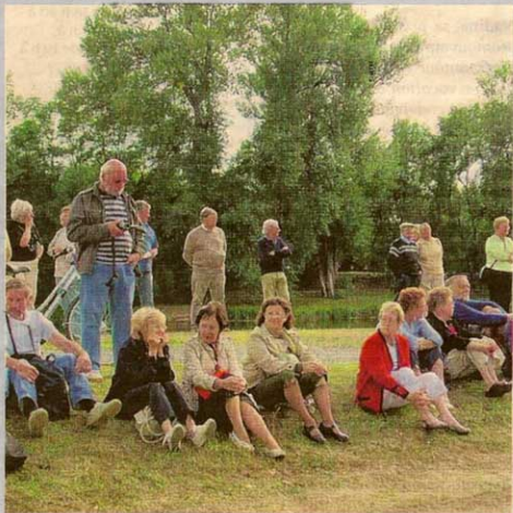
Le public a apprécié les animations sur le bord de la rivière.

Une grande animation régnait, samedi, sur le Cher à Chisseaux. Le Syndicat du Cher canalisé, se battant pour sauvegarder ce patrimoine, y avait organisé une grande fête :