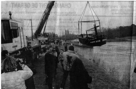
Arrivée en début d'après-midi par convoi exceptionnel depuis Bergerac en Dordogne, la gabare « Carpe Diem » qui pèse huit tonnes a été mise à l'eau à l'aide d'une grande grue élévatrice.

Une gabare de 12 m vient de rejoindre le bateau-mouche " La Bélandre " au ponton de l'écluse de Chisseaux, sur le Cher, à quelques encablures des arches de Chenonceau.