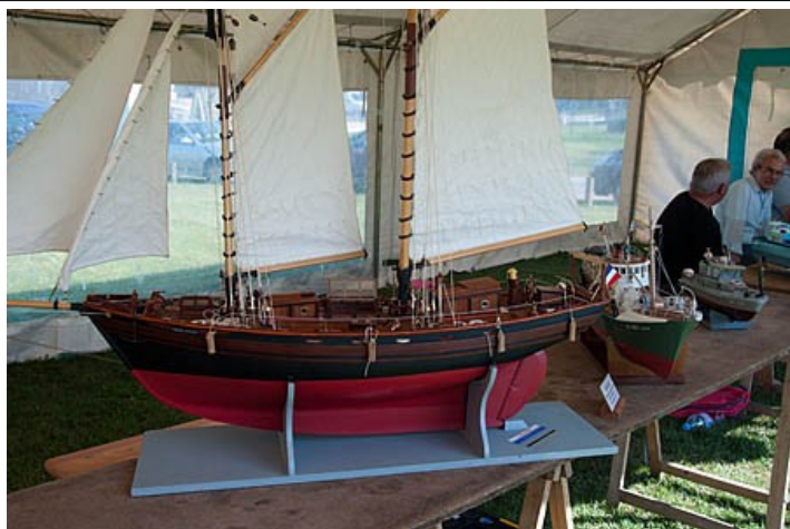
L'exposition de maquettes, chaque année appréciée