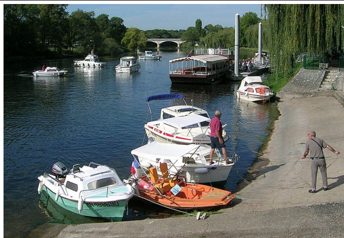
Une partie de la flotte présente à la 5ème fête du Cher