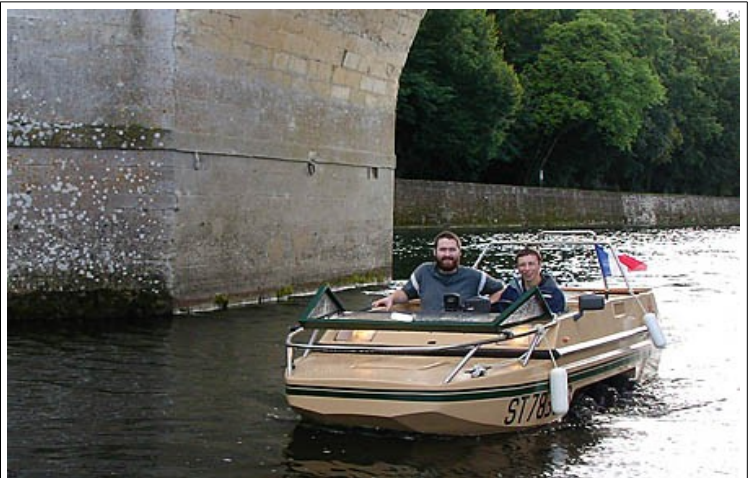
Et sous le château de Chenonceau