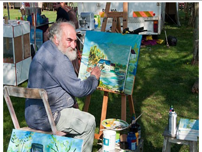
Le peintre local et son sujet préféré : le Cher