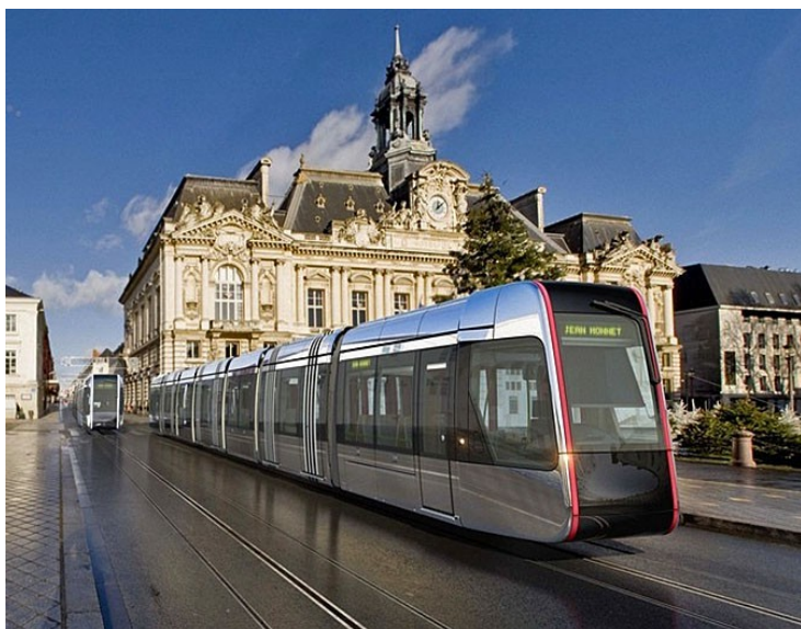
Le futur Tramway, Place Jean-Jaurès

Le tablier métallique du nouveau pont sur le Cher, construit pour le passage du tramway à Tours, relie les deux rives depuis le 10 novembre. Le chantier sera bouclé en avril. D'une longueur de 225m sur 13m de large, ce pont supportera le passage du tramway, des bus, des vélos et des piétons. Sa structure sera peinte en bleu car c'est la couleur de la ville de Tours depuis des siècles, a justifié Jean Germain, maire de Tours. L'élu a également profité de son temps de parole vis à vis des opposants au tramway, balayés pour l'instant sur le terrain judiciaire. L'action menée par un géographe tourangeau ( débouté en référé) devant le tribunal administratif d'Orléans contre la construction de ce nouveau pont sur le Cher n'inquiète pas Jean Germain. (Extrait d'un article NR du 11/11/2011)