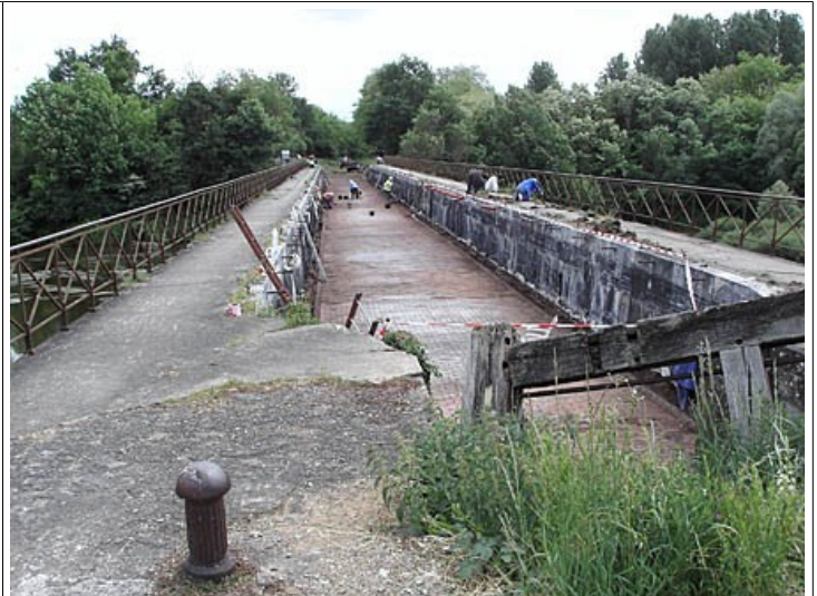
Un beau travail que nous devons prendre en exemple

L'ARECABE ( association amie pour la Réouverture du Canal de Berry) a entrepris le nettoyage du pont-canal de la Tranchasse, rendant ainsi ses lettres de noblesse patrimoniales à cet édifice. Ceci mérite un grand coup de chapeau. En prenant certaines choses en main, les associations comme l'Arecabe montrent que beaucoup de choses sont possibles devant les pouvoirs public et le public tout court. Un bel exemple à suivre.