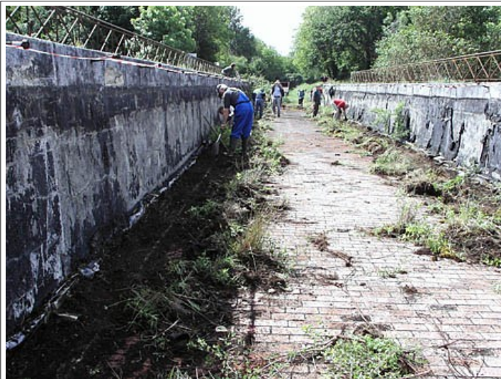
Pont canal de la Tranchasse – Les bénévoles au travail

14 JUIN 2011 On manifeste sur l'écluse de Civray. 400 personnes dont beaucoup d'élus 37 & 41 en écharpes ont répondu à l'appel de M Kerbriand, Conseiller Général 37, relayé en ce sens par Les Amis du Cher qui ont également recueilli plus de 2500 signatures. Il sera intéressant de voir ce que décidera le nouveau préfet pour 2012.