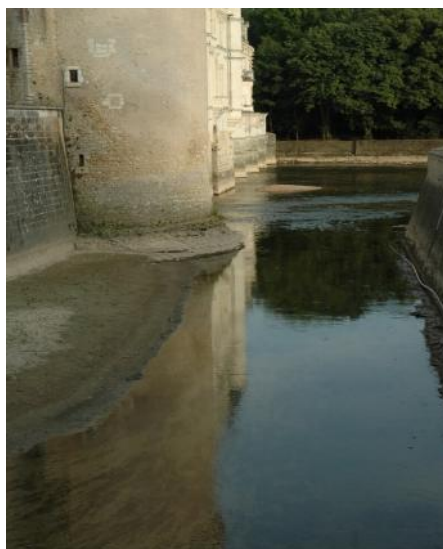
Bases du château de Chenonceau vue par les touristes

Le Bateau Hotel Le Nymphéa, lui, est condamné à rester au fond de l'écluse de Nitray. Une perte sèche pour cette entreprise. Lui qui accueillait de nombreux visiteurs étrangers, quittera peut être le Cher.