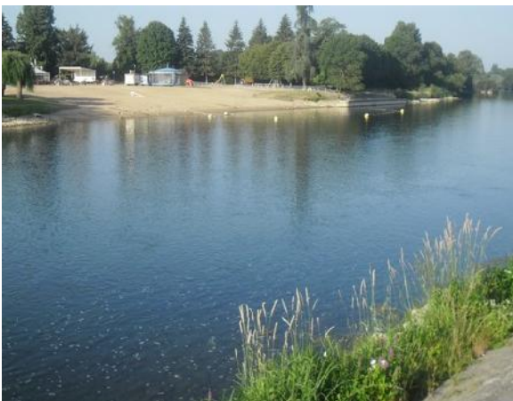
Plage de Montrichard réduite à un petit bassin