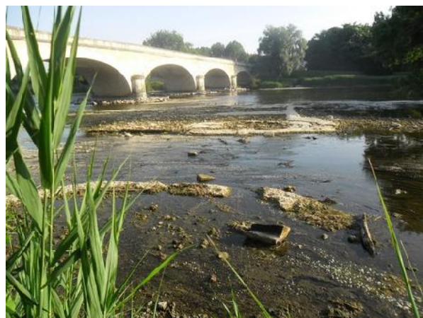
Pont de Bléré oued du département

Comme une photo est plus parlante qu'un long discours voilà le résultat des barrages endommagés au mois d'octobre 2012